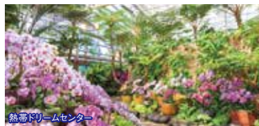
熱帯ドリームセンター

8:20集合 県庁前パレットくもじ(ニッポンレンタカー前) 8:50集合 おもろまちTギャラリア(洋服の青山側)