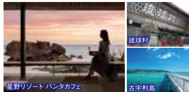
星野リゾート バンタカフェ

8:35集合 県庁前パレットくもじ(ニッポンレンタカー前) 9:05集合 おもろまちTギャラリア(洋服の青山側) 9:45集合 北谷(ちゃたん)アメリカンビレッジ 北谷観光情報センター前