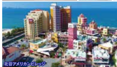
北谷アメリカンビレッジ

8:35集合 県庁前パレットくもじ(ニッポンレンタカー前) 9:05集合 おもろまちTギャラリア(洋服の青山側) 9:45集合 北谷(ちゃたん)アメリカンビレッジ 北谷観光情報センター前