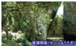
斎場御嶽(せーふうたき)