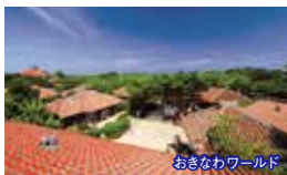
おきなわワールド

※最少催行人数はホテル送迎付の場合となります。お1名様からのアクティビティのご予約も承っております。